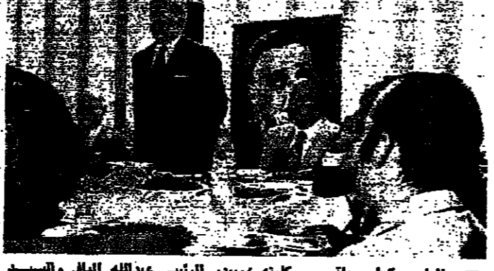
الرئيس كراي يقبل كفيه ويودع الرئيس عبدالله اليان والسيد كمال شاتلا امين العام للتنظيم الناصري في مدينة حاصم تقصوده ..